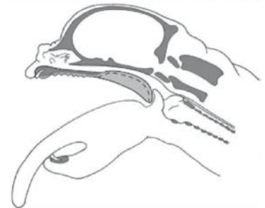
Vista lateral de la hiperplasia del paladar blando en perros braquicéfalos. Findji and Dupré, 2005.

Darke, 1989; Buchanan, 1999, 2001; Fuentes, 2003